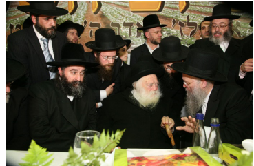
רבינו משתתף בחגיגת סיום