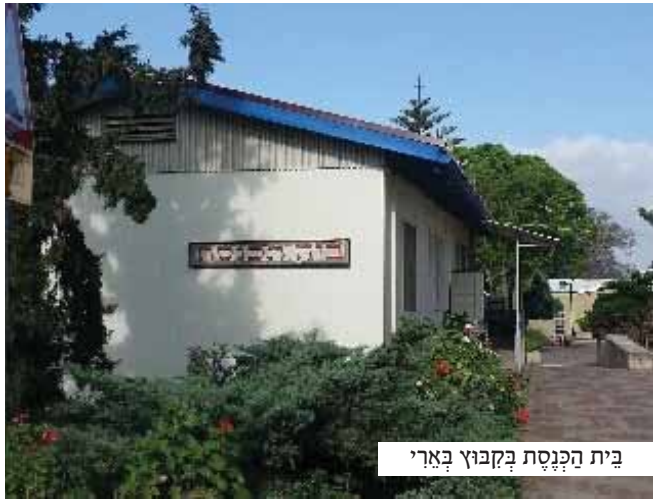
בית הכנסת בקבוץ בארי

במשך שעות ארוכות נמשכה הלחימה סביבם, הבית בער ונחרב עד היסוד, העשן החל לחדר מתחת לדלת הממ"ד, ובגני המשפחה צפו לגרוע מכל, אך למרבה הפלא במשך כל אותן שעות ארוכות הממ"ד נותר בשלמותו.