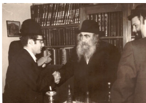
תמונה נדירה: מרן הסטייפלר בביתו של ר' ישראל בשבע ברכות לבנו ר' שרגא שלמה שליט"א

באחת הפעמים שהיה אצלו, והגיע שעת תפילת מנחה הציע ר' ישראל למרן הסטייפלר שיאסוף מנין עבורו בביתו, אמר לו הסטייפלר: "זה לא תרדה בו בפרך", שאלו ר' ישראל: 'הרי האנשים רוצים להגיע', ואמר הסטייפלר בביטול: 'לא, הם לא רוצים לבא הם לא רוצים לבא...' למעשה כיון שהיה כמעט מנין כשמונה אנשים אספו עוד בודדים שישלימו למנין.