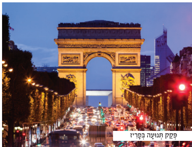
פקק תנועה בפריז

במהלך דרכו הארכה הוא נעצר בבית כנסת לתפלות השבת, ורק קרוב לאחת עשרה בלילה הוא הגיע לביתו. בני ביתו היו מדאגים מאד, והוא הרגיעם וספר להם את קורותיו. אחר פנה לטל ידיו לסעודת השבת. לאורך כל השבת גרש את הדאגה מלבו ושמר על קדשות וענג השבת.