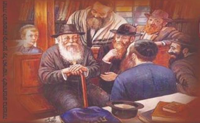
יחידה למסע חינוכי לילדים על האישיות ליהדותם במבוא