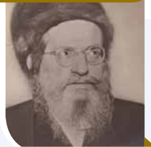
בעל ה'סלם' זצ"ל