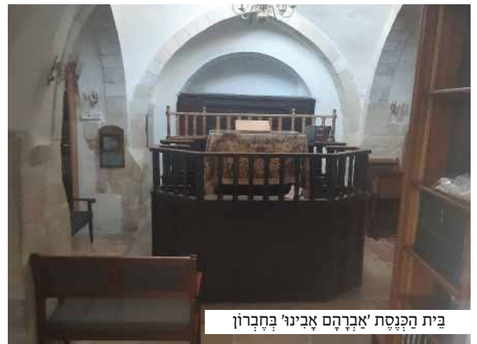
בית הכנסת 'אברהם אבינו' בחברון

דלת בית הכנסת נפתחה, ובעדה נכנס יהודי מבגר ובלתי מפר, בעל תאר פנים הדור עד למאד ומראה נורא הוד. האיש נכנס בלאט לבית הכנסת וברך את המתפללים במאור פנים, מאן דהוא הציע לו דבר מאכל לסעודה מפסקת, אך האיש הודה לו וטען שכבר אכל, ומשכך נגש החזן מיד לאמירת 'פל נדרי'.