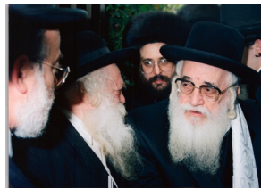
האדמו"ר ה'ישועות משה' נותן שלום לרבינו כשנפגשו בשמחה

דבריו של רבינו עשו פירות, גבאי בית המדרש נחלצו לסדר את הענין, ואמנם לא עלה בידם לסדר שכל בית המדרש כולו יופעל רק ידי חשמל כשר, אבל השתדלו לסדר מעט לכבודו של רבינו.