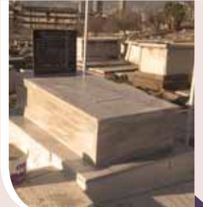
ציורו של בעל ה'שבט מוסר' בעיר איזמיר שבתורכיה