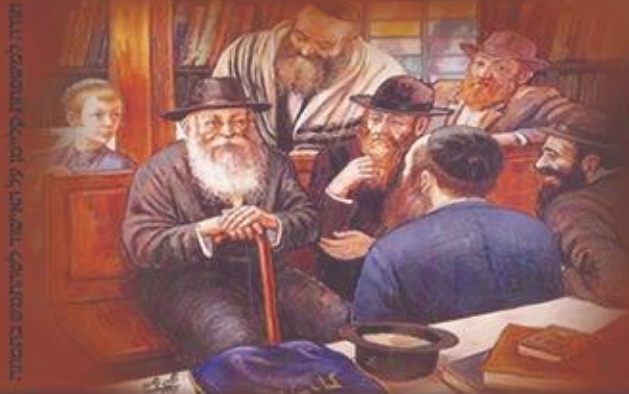
חידו למוסדות קיימ"ע על האישור לפרסום במוסדות