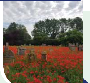
בית הקברות היהודי במנטובה