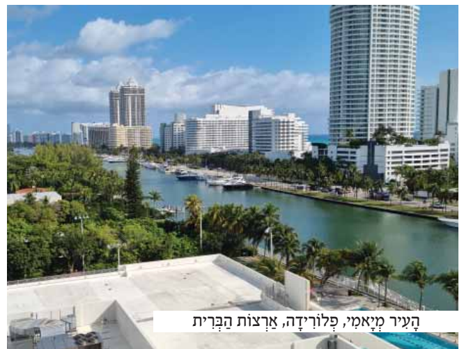
העיר מיאמי, פלורידה, ארצות הברית

הפרופסור הביט בו במבט עצוב ורציני ואמר: ”הטפול אינו קשה כלל. הוא נתן בזריקה חד פעמית ואינו גורם לתופעות לוואי רציניות. אולם במקרה שלכם... כנראה אחרנו את המועד. אלו היינו יודעים את התוצאות קודם לכן, אולי עוד אפשר היה להספיק לטפל, אך כעת איני רואה שום סכוי לכך. קשה לי לומר לכם את הדברים, אך אלו העבדות, אני מצטער...”