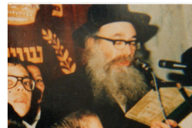
רבי ניסים קרליץ