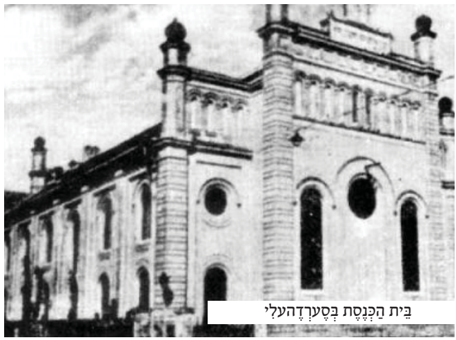
בית הכנסת בסערדהעלי