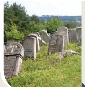
בית הקברות בבוטשטש