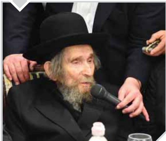
זיפח באפיו נשמת חיים (בי')

מרן הגראי"ל שטיינמן זצוק"ל על הנשמות שרעבות לכל פרוטה של צדקה