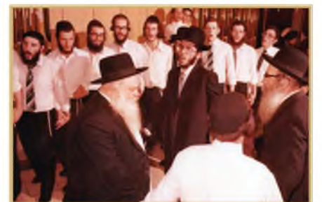
[א] פרסום ראשוני: רבינו בשמחת חתן, בנישואי בת אחותו עם רבי דוד סקלר שליט"א, נראה בימיו רבי ניסים קרליץ זצ"ל