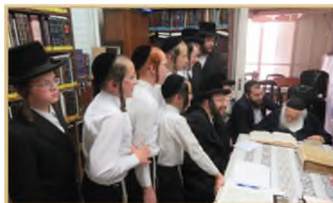
[ב] "לא לשקר גם כשנראה שיבאי תועלת" רבינו בוחן ילדים