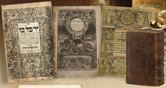
פרשת תזריע מצורע