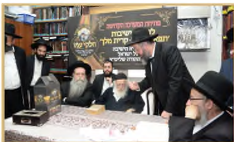
[ג] רבינו משתתף במגבית עזרה ליישוב 'קרית מלך' הקרויה על שם ספרו שעל הרמב"ם

וכך בשניות אחדות, גם ברח רבינו ברכת הנהנין, גם חסד ליהודי, וגם הספיק עוד ללמוד עד שהבא בתור נגש ---