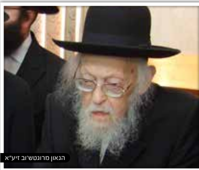
הגאון מרונגטשוב זיע"א