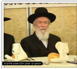
הגאון רבי יצחק זילברשטיין שליט"א

הוא מתאר שכל מפגש שלו עם כלב, מקדמת דנא, היה מסתיים בטראומה, 'ואיני יודע עתה כיצד להסתדר עם הצרה החדשה הזו שבאה עליי. כל פעם שאני יוצא מביתה של בתי לתפילה, הנני נתקל בכמה כלבים גדולים, הגורמים לי לפחד וחלחלה; האיש היה נתון בפחד שכזה, עד שבא לשאול האם בגין זה הוא פטור מללכת לתפילה במנין... אמרתי לו בו ונעיין קצת במקורות