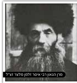
מרן הגאון רבי איסר זלמן מלצר זצ"ל

"אספר בזה סיפור נפלא ביותר שהיה לאאמו"ר עם מרן הגרא"ז מלצר זצ"ל: טרם נישואיו נכנס אאמו"ר לקבל את ברכתו של הגרא"ז זצ"ל, בתום ביקורו העניק הגרא"ז במתנה לאאמו"ר זצ"ל