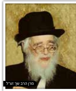
מרן הרב שך זצ"ל

מורי ורבותי! אני מבקש לשאול אתכם שאלה קטנה: בישיבת פונביץ' מתפללים יותר מאלף אנשים בימים הנוראים. יש עוד מישהו אחד שיודע שהוא חייב בהכרת הטוב לבעל התפילה?