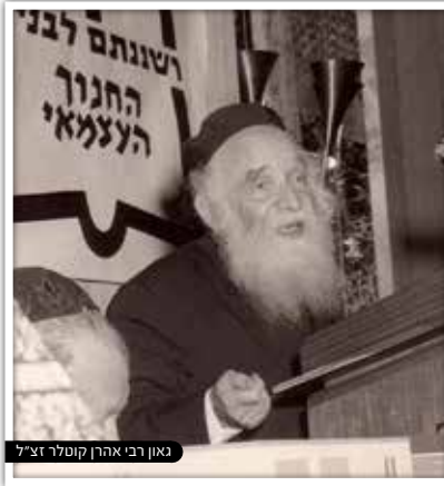
גאון רבי אהרן קוטלר זצ"ל

אותו הגאון, רבי אהרן קוטלר זצ"ל, כשהיה מתלהט בריתא דאורייתא להסביר את ההבנה הנכונה ולהוציא מן הטעות, לא היה דבר שיכל להסיח את דעתו. פעם אירע הדבר בעיצומן של ההכנות האחרונות לפתיחת ה'דינר' לטובת ישיבתו, ישיבת ליקווד המעטיה, גדול מרכזי התורה בארה"ב ובעולם. הדריכות היתה בשיאה והמוזמנים עמדו להגיע, כאשר התעוררה אצלו לפתע קושיה חמורה בלימוד, ומיד הרצה אותה בפני אברך שעמד לצידו. האברך ניסה לענות, אך דעתו של רבי אהרן לא נחה מתירוצו, וכך התלהט המשא ומתן, ורבי אהרן התלהט וקולו עלה עד כדי צעקות רמות, והכל מתוך פלפול סוער ומעמיק. בינתיים התחילו כבר להגיע ראשוני המשתתפים ל'דינר', המארגנים החלו לרמוז לרבי אהרן שאין הדבר מתקבל יפה, אנשים שומעים ולא מבינים שמדובר במשא ומתן של הלכה,