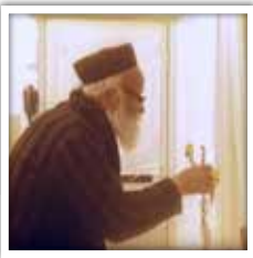
מרן הגר"ד פוברסקי זצ"ל