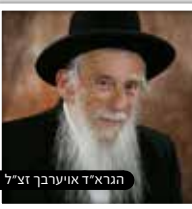
הגרא"ד אויערבך זצ"ל