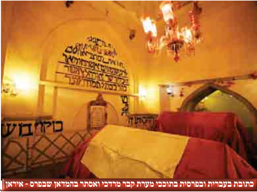
כתובת בעברית ובפרסית בתוככי מערת קבר מרדכי ואסתר בהמדאן שבפרס - איראן

היות ומסביב לב"ע בנוו במשך הזמן בנינים חשובים ונהיה למקום מרכזי, ובימים ההם יהודי פרס בכלל ועדת המדאן בפרט היו כאניה המטורפת בים הגלות והצרות והמים הזידונים מי אכזריות והקנאה המתבילה, העריצות והמשטמה הדתית עם כל גליהם ומשבריהם עברו על נפשם. כתיב הדת ונכבדי השיעים השתמשו בהזדמנו זו, חללו את ב"ע הנז' כבשו חלקים חשובים ממנו ובנו עליו בנינים ענקיים הנמצאים עד