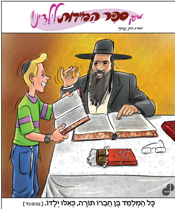
כל המלמד בן חברו תורה, כאלו ילדו. [בגיים כ"ד]

אלא שהתורה הקדושה מלמדת אותנו שכאשר האורח מגיע רק בשל הנימוס והוא ממנהר לדרך,