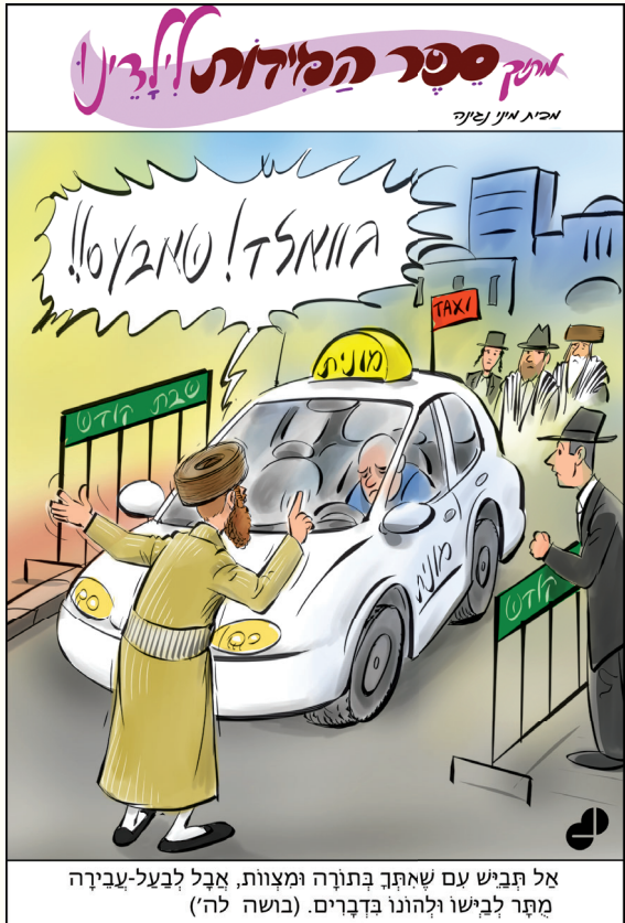
אל תבייש עם שאתך בתורה ומצוות, אָבֵל לְבַעַל-עֵבִירָה מְתֵיר לְבִישוֹ וְלִהְיוֹנוּ בְדָבָרִים. (בושה לה')