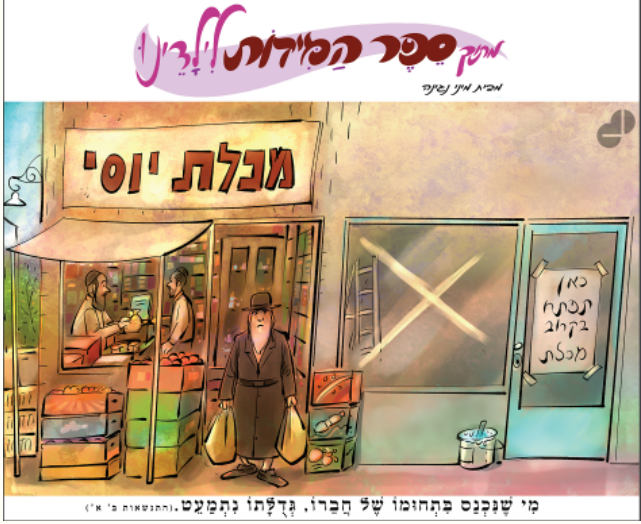
מי שנקנס בתחומו של הברו. נְדָרְתוּ נְהַמְעַט. (המשניות ב' א')

בדיוק לפני מאה שנה, בליל שבת קודש י"ד בכסלו שנת תר"פ, נכנס רבי דוד אבוחצירא לבית הכנסת לקבלת שבת, והציבור נאחז כולו בבהלה רבה. רבי דוד לא החליף את גלימתו השחורה של ימי החול, בגלימה לבנה צחורה המיוחדת לשבת... כאילו באָּגֶל הוא שרוי כעת.