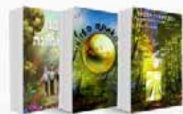
בן האמונה הספר ששינה לאלפים את החיים