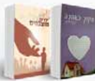
חינוך ילדים המתכון לילדים מוצלחים