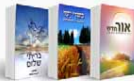
דרך להתקדש קדושת האדם, הרוחניות והגשמיות והדרך הנכונה להשגתה