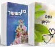
להצליח במבחני החיים איך עוברים את המצבים הקשים בחיים