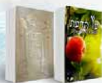
פירושים פירוש על ספר בראשית ופרוש על ל"מ