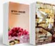
המתכון לשלום בית הדרכה לחיי הנישואים מתוך כבוד ואהבה