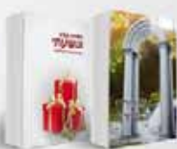
אור התורה לומר תודה ולהודות בכל מצב