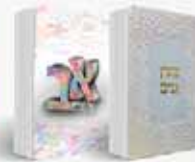
ספרים שחשוב בחיים א, ב, ג של החיים ומעין ננים