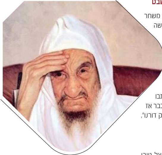
אמונה בצדיק בהשם יתברך. מתחילה מהאמונה

פנו ההורים אל הבבא סאלי להודות לו, אמר להם הבבא סאלי: "אל תגידו לי תודה רבה, זה הכל בזכות האמונה שלכם שהאמתם בקב"ה לבדו, עד כדי כך שהייתם מוכנים לעזוב את בית החולים וללכת הביתה".