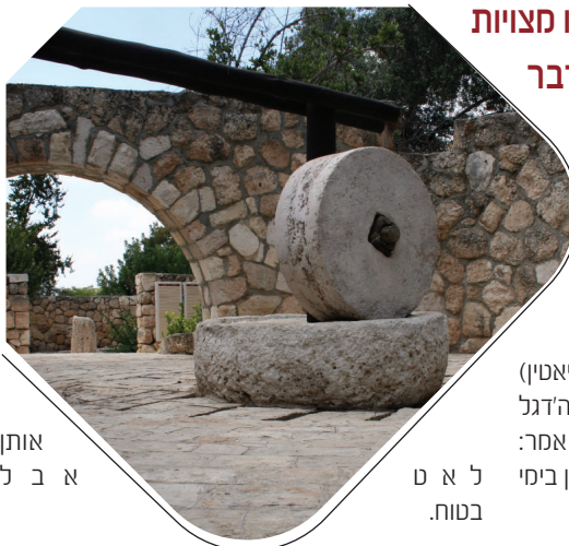
אותן א ב ל