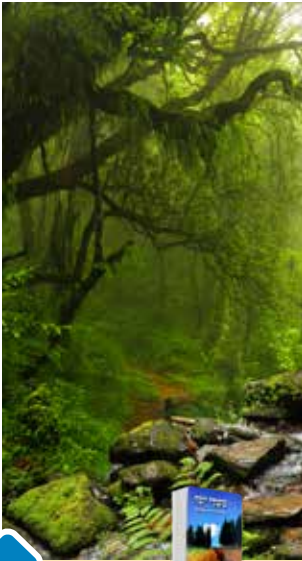
התבודדות ומעלת התפילה הספר של הרב שלום ארוש 052-2240696

שמחה, חיים ללא פחד וללא מורא משום דבר חיצוני - צריך שתהיה לו בכל יום שעה שבה הוא יעשה חשבון נפש, ויעשה תשובה, וידבר עם ה', ויספר לפניו את כל ליבו, וכל דבר שרואה שפגם, יבקש מה' סליחה ומחילה, ויאמר: "ריבונו של עולם! תמחל לי, כך וכך חטאתי לפניך, אני מבקש ממך סליחה, אני מבקש ממך מחילה, בבקשה תכפר לי, הקדוש ברוך הוא, אל תכעס עלי, ריבונו של עולם, תעשה עמי חסד ותאריך אתי אף, אני מתחרט על זה. וכן יאמר: ריבונו של עולם, תעזור לי לעשות חשבון נכון - מה הרווחתי מהעוון? הלא העוון בעצמו הוא עונש, עונש נורא שמרחיק אותי ממך.