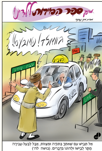
אל תבייש עם שאתך בתורה ומצוות, אכל לבעל-עבירה מותר לבייש ולהונו בדברים. (בושה לה)

כשסיים החכם הספרדי הנ"ל לספר את המעשה הזה לרבי מרדכי יפה בעל הלבושים אמר לו: "אל תתרעם עלי שנידתי אותך כי עשיתי זאת למען תהיה הבושה היא כפירה על עוונך ואני מוחל לך אבל בתנאי שתדרוש ברבים ותספר להם את הסיפור הזהירם על עניית אמן."