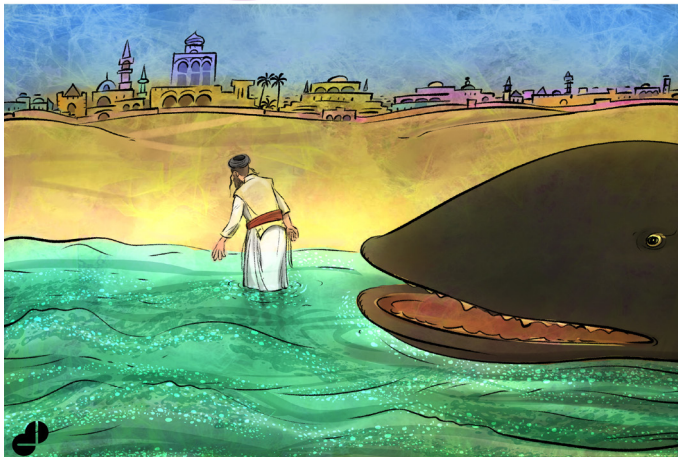
הקדוש-גורן-האז משרה נבואתו על נביא של שליחות בהפסק. אפילו אינו חכם. [דעת יא']

לרגע אחד לא שכח את בקשת האדמו"ר. בצהרי היום הוכרזה הפסקה קצרה, ואחריה עתיד היה הד"ר מירושלים לשאת את נאומו. הוא חש דריכות והתרגשות בגמר ההפסקה הזמין המנחה את הרופא מיישראל, והד"ר ניגש אל דוכן הנואמים. "עמיתיי הרופאים", פתח ואמר. "הקשבתו בעיני רב לדוברים המכובדים, ואף רשמתי לעצמי אי-אלה הערות על כמה מדבריהם. ואולם הפעם אבקש לנצל את הופעתי לפניכם, להעברת מסר חשוב שנתבקשתי למסור לכם על-ידי רבי, רב חשוב וזקן מירושלים".