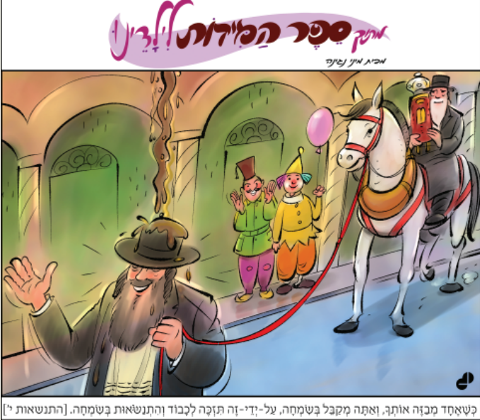
קשאחד מכזה אותך, ואתה מקבל בשמחה, על-ידי-זה תזכה לכבוד והתנשאות בשמחה. [התנשאות י']