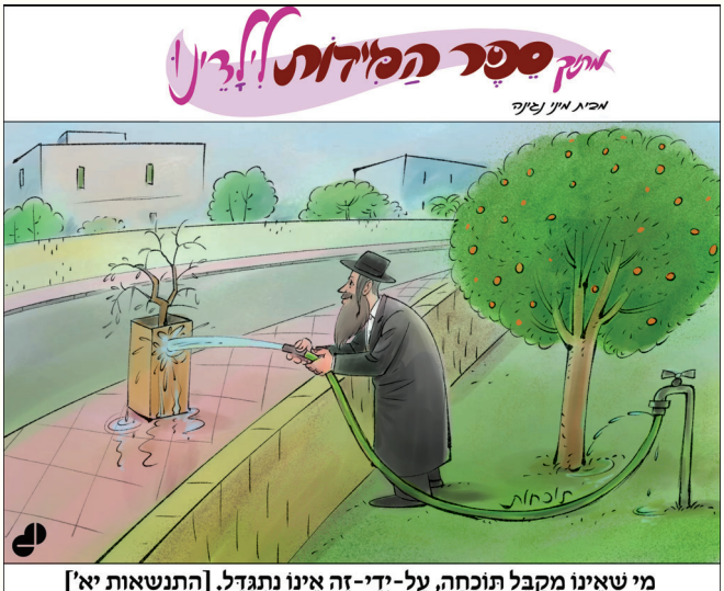
מי שאינו מקבל תוקחה, על-ידי-זה אינו נהגדל. [התנשאות יא']

כ כ ל ש ג ר ו והתרבו חיוניהם של הטבריינים, עלה מפלס ה ח מ ס והזעם בלבו ה ר צ ח נ של המושל ה ס ו ר י, ש נ ו כ ח שפגיעותיו ח ד ל ו מ ל ז ר ו ע ח ו ר ב נ ו א ב ד ו ת בעיה. לאחר ד ר י ש ה ו ח ק י ר ה מ א ו מ צ ת