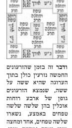
בנמצא ארבע הקרנות בנייין. ולא אפשר למיור טפח מן הכי בן טפח [שחיה] בה השעה ורעיון שבין כל אחד להבירו טפח ומחצה, וארבע בחוכן, אבל אם הוועיון חזן לשהי, איפשר שריא] בה השעה ורעיון שבין כל אחד להבירו טפח ומחצה, וארבע בחוכן.

דקיס לוח לרבנן דחמשה זרעונים בששה טפחים לא ינקי הדרין וכל דקיס לוח לרבנן מילתא היא ואביא יובסי הארץ שבקאיין בישיבתה של ארץ ברברין לחן אליו מילי וליקאי הדני ששה ערוגות תן מקום רעונים ואביא סביבתיהן טפח ובלוי ומפרש במתי היה לו בגבול טפח וזרע לחמה ששה עשר ורעיון. ומפרש הכא בר אמי דהא ערוגה ששה על ששה חזק מגבוליה ועיקר דהא מילתא, וילא וליקאי למחנה בין דקיס לוח טפח אחד, והוא הוה מן טפח בין דקיס לוח טפח אחד, אפילו ערוגה שריא חמשה לפניו חמשה הוה אפיסק לפרש שמונה על ארבע רוחיה, וארבע בארבע, י"ב מוקן הן רעיון, דאדעמייקין למינה רבין, דדיוני מרז טפח באר חמשה, דאיסחבא דליה באר ההן, וילא כי דאיסחבא לית בהיה, אלא קים ליה לרבנן דהא זרעונים על אחד אין פחות טפח על טפח, בששה על ששה לא ינקי מרדרי, והכי טפח לא זרע טפח ומחצה על טפח ומחצה חרב, ובבל דהו ששה טפחים ארז (ורק) ברובח טפח ובאבעין (ורק) אחד טפח על טפח, דמשכתה בין כל אחד זאת אחד טפח ומחצה בארז. וכן זרעיה למראיה ע"י.