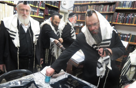
'אבא שלי ראה הכל ולא העיר כלום' בנו הצעיר של רבינו, הגרי"ש, נותן צדקה מעומד, באמירת 'אתה מושל בכל' בתפילת שחרית.