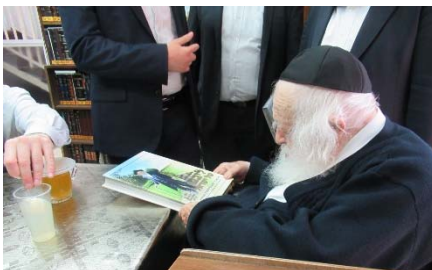
לידיו ספר מתולדותיו של מרן הגר"י אדלשטיין זצ"ל ומעיינ' בו שעה ארוכה.

רבינו רגיל להביא את דברי המכילתא (יתרו פרשת בחודש, פרק ב' בפסוק ומשה עלה) 'כה תאמר לבית יעקב' - אלו הנשים. 'ותגד לבני ישראל' אלו האנשים. רואים כאן שהכינוי 'בית' הוא על נשים, שמקומם בבית. ובזה דרש כמה מקומות בתורה שנזכר בית יעקב, שהכוונה על נשים (ראה טעמא דקרא בשלח בפס' ויקרא בית ישראל את שמו מן, ובפרשת אחרי בפסוק איש איש מבית ישראל, דהכוונה על בית יעקב - הנשים, ובפר' ברכה בפסוק יורו משפטין ליעקב 'ותורתך לישראל' הולך על הנשים, ובישעי' ב' בפסוק בית יעקב לכו ונלכה, ובישעי' כ"ז הבאים ירש יעקב יצין ופרח ישראל, ושם פרק נ"ח בפסוק והגד לעמי פשעם וגו').