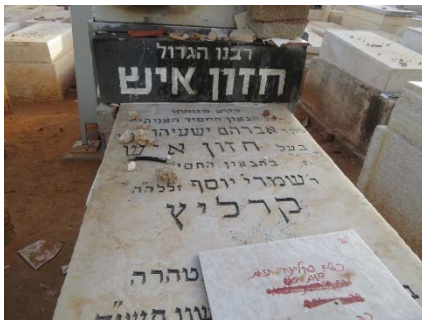
קברו של מרן החזון איש, בחזית ניתן לראות לבינה עם הכיתוב "כשם שהלבינה הזו בערה באש כך תבער בלבו של..."

אחד הסגולות שהתפרסמו בשנים אחרונות, הוא לקחת לבינה שרופה באש או בתנור, לכתוב עליה בעט מודגשת כשם שבערה לבינה זו באש כך תבער בלבו של... (שם הילד שצריך ישועה) שיילך בדרך הטוב, ולשים על מציבת קברו של צדיק. סגולה זו, שאיננו יודעים את מקורה, התפרסמה מאוד, עד שניתן לראות כמעט בכל קבר של צדיק או צדקה, לבנים שכאלו... כמדומה ששמענו מרבינו שאינו יודע מקור לזה.