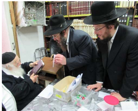
רבינו מקבל לידיו מבנו של הגר"א גניחובסקי זצ"ל, ספר חדש מתורתו.

שאלו את רבנו, אם כן גם מהצלחת שאוכל בה אדם גדול יש סגולה, וענה אין הכי נמי.