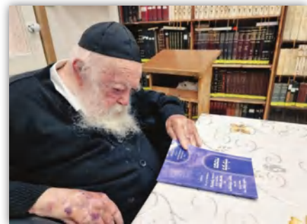
ביום היארצייט לאביו מרן הקהילות יעקב זי"ע רבינו בלימוד משניות לע"נ

בנו חביבו הגרי"ש שליט"א מוסר בשליחות רבינו שיעור לע"נ זקנו הסטייפלר זי"ע