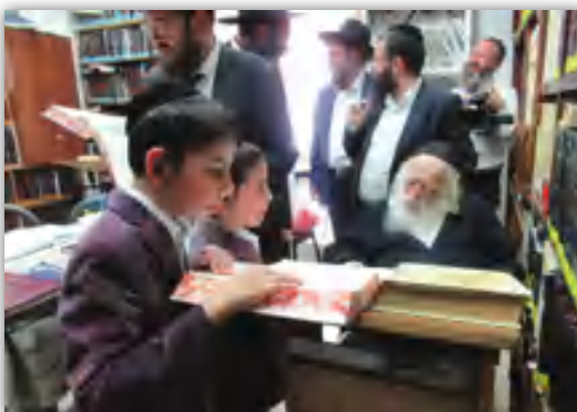
אינו מסרב לנערים שמבקשים לגמור את הקטע האחרון ולערוך את הסיום במעונו