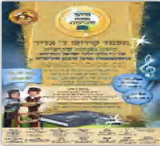
סיומ מסכת שנלמדה על ידי אלפי ילדים