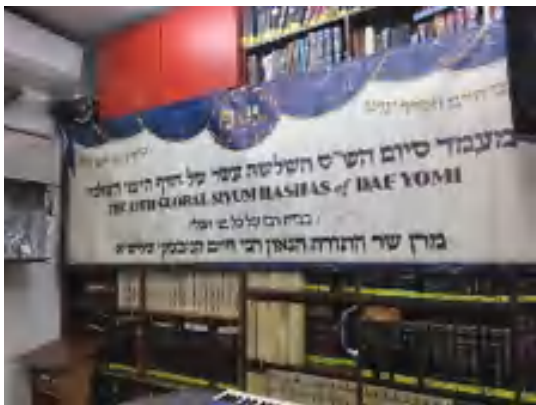
הכנות לשידור מביתו של מרן שליט"א למעמד סיום הש"ס הגדול שנערך בתחילת שנת תש"פ

החינוך במצוה מצוה צ"ה מפרש בטעם שהחוטא מביא קרבנות, 'הלא אמרנו כי עיקרי הלבבות תלוין אחר הפעולות, ועל - כן כי יחטא איש לא יטוהר לבו יפה בדבר שפתים לבד, שיאמר בינו ולכותל חטאתי לא אוסיף עוד. אבל בעשותו מעשה גדול על דבר חטאו, לקחת ממכלאותיו עתודים ולטרוח להביאם אל הבית הנכון אל הכהן, וכל המעשה הכתוב בקרבני החוטאים, מתוך כל המעשה