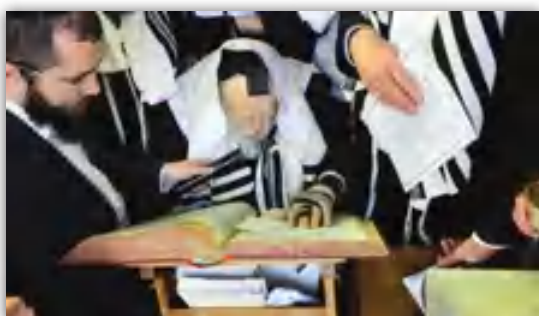
הפעם היחידה בה הופיע באופן רשמי בפני ציבור בשנים המוקדמות