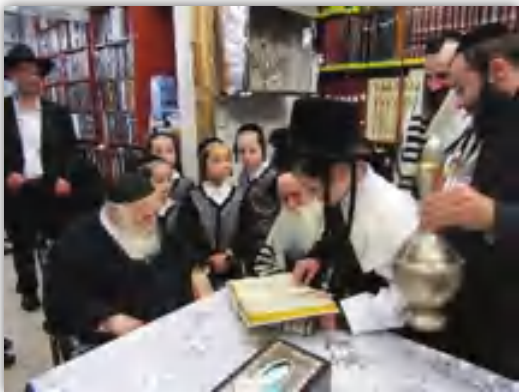
נער בר מצוה מסיים מסכת במחיצת רבנו שליט"א