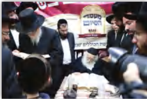
הגאון הגדול רמ"ה הירש שליט"א לצד רבינו מרן שליט"א