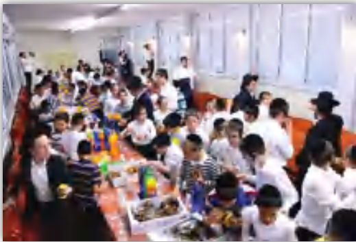
ילדים בסעודת מצוה של סיום של סדר משניות שלמדו