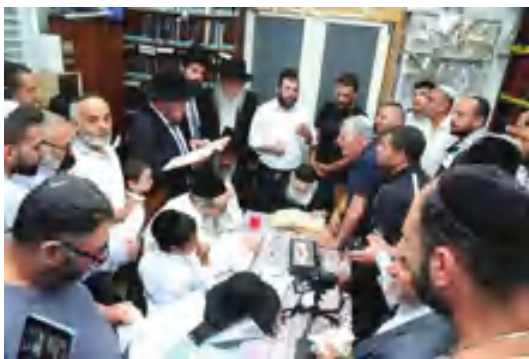
המהפכה בעיצומה. תושבי מושב 'אזור' בסיום מסכת במעונו של רבינו. מי האמין?