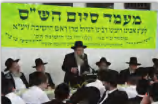
הגאון הגדול שליט"א באחד מסיימי הש"ס

"יומא טבא לרבנן, מסיבת סיום מסכת שנלמדה על ידי בני הקהילה בדף היומי מידי ערב",