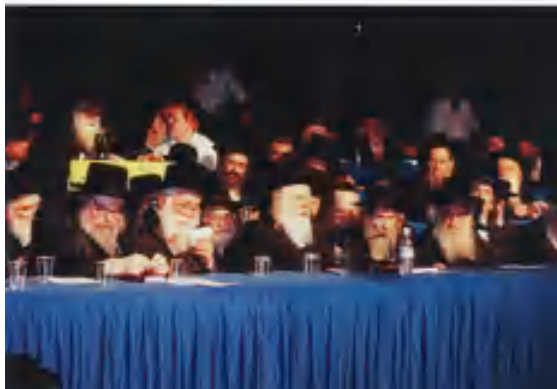
מעמד סיום הש"ס העולמי שנת תשנ"ז

הגדול הוא יקבע בנפשו רוע החטא, וימנע ממנו פעם אחרת.