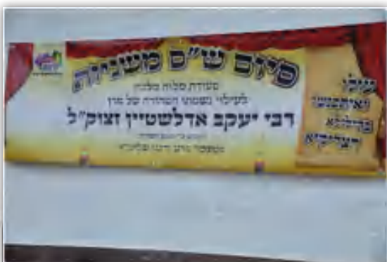
סיום ש"ס נהפך ב"ה לדבר מצוי