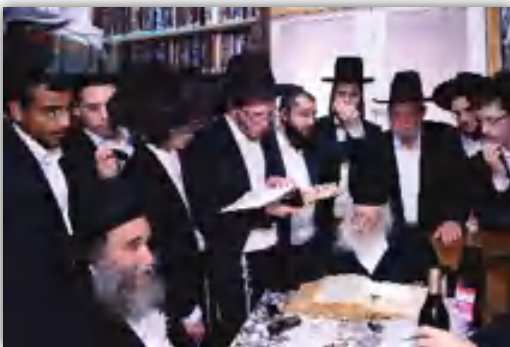
בחורי ישיבת 'אורחות תורה' בסיומ מסכת שנלמדה בין הסדרים