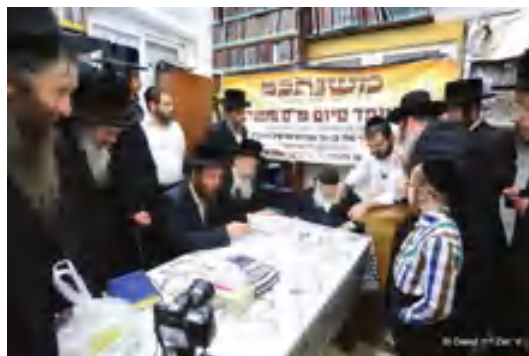
סיומי ש"ס משניות במעונו של רבינו שליט"א