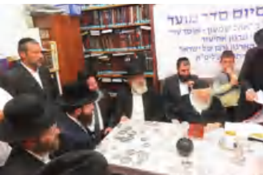
קבעו עיתים לתורה וזכו לסיים מסכת