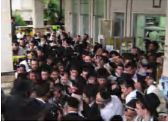
חלק מהציבור האדיר שהגיע בשנים האחרונות למעמד הסיום בערב פסח

גם אנשים שאינם שומרי תורה ומצוות באופן מלא, קובעים עיתים לתורה ואף זוכים לסיים מסכת לעיתים.