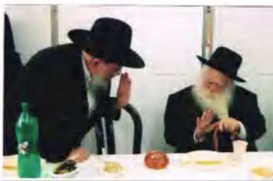
רבינו שליט"א משתתף בסיום שנערך על ידי שומעי השיעור הקבוע של הגר"י שוב שליט"א