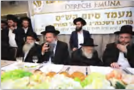
משתתף בסיום הש"ס שע"י כולל 'דרך אמונה'

אבל רבינו בשלו. וברצות ה', גם הנחיל אותה לשאר העם. וכפי שאנו רואים,