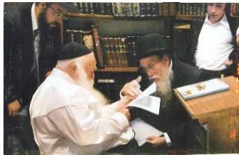
בערוב ימיו בהתייעצות עם רבינו שליט"א

נשמח לקבל מקוראינו הנאמנים מסמכים, תמונות, עובדות ומעשיות הקשורים להנ"ל