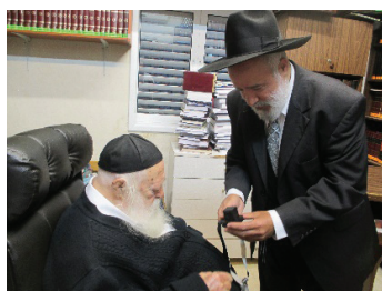
רבינו מעיין בריבוע התפילין

והוה מעשה ש'בית' אחד ניקב בראשו וניסיתי בעצמי לסתום את הנקב על ידי הרטבת העור וניפוחו, ואחרי זה חזרתי עם הפרעס על בית ונסתם הנקב לגמרי, והלכתי אל מרן החזון איש זצ”ל ושאלתי אותו אם בכהאי גוונא התפילין 'כשרות' והכריע לי שאכן הבית 'כשר', והוספתי לשאול אותו האם בית כזה עלי למכור בזול יותר או אפשר למכור אותו כמהודר רגיל, והורה לי שאמכור אותו בזול יותר.