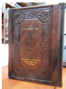
"עם כתבים מרבי יוסף ראזין בעל הצפנת פענח, עם הערות" הכיתוב שעל הכריכה על פי בקשת רבינו