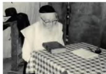
רבי אריה לוי זכרונו לברכה