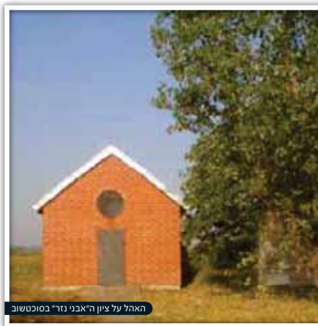
אהבה על ציון האבני נזר בסוכטשוב

כוחו של הש"ך התגלה גם לאחר פטירתו, מעיד ה"אבני נזר", כפי שסיפר יהודי ששמר את מפתחות בית העלמין שבו היה הש"ך טמון, באחד הימים הגיעו שתי נשים בוכיות לשומר בית הקברות ובקשו ממנו את המפתח, הן נכנסו פנימה והתפללו על קברו של הש"ך, ולמחרת היום באו שתיהן שמחות ומאושרות, ושוב ביקשו את המפתח, כששבו מתפילתן, התעניין השומר אודות פשר העניין, והן סיפרו כי ביתה של אחת מהן ירדה מן הדרך ועמדה להתחתן עם גוי, וככל שניסו להשפיע עליה, אטמה את לבה משמוע. אמש הגענו ובכינו בסמוך לקברו של הש"ך, ספרו הנשים, והנה, כששבנו הביתה נודע לנו שאותו גוי נהרג... באנו אפוא, לומר תודה ליד קברו.