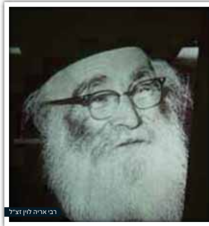
רבי אריה לוי זצ"ל

”בחדר זה מתגורר, מזה זמן רב, יהודי עני מוותיקי עובדי החברה קדישא, וליבנו עליו, אי אפשר להוציאו משם”, ענו המנהלים. אמר להם רבי אריה: ”יש לי היכרות טובה עם אותו יהודי שמתגורר שם, נראה לי כי אצליה לשכנעו לעזוב את החדר, אך בתמורה לכך, עליכם לרכוש לו דירה חילונית בקרבת מקום”, הסכימו מנהלי החברה קדישא לעסקה, ורבי אריה שמח בלבו, כי יותר מאשר דאג לכבוד המת, דאג למצוקתו של היהודי, להעמידו בקרן אורה, להקים בית בישראל.