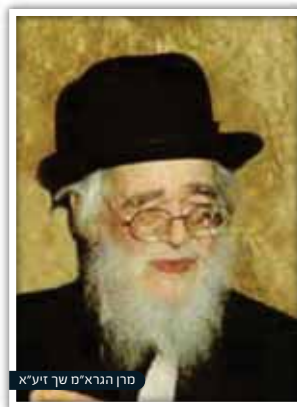
מרן הגרא"מ שך זיע"א

אולם רבינו, כלל לא התפלא... לדידו, היו הדברים פשוטים וברורים, וכך אמר לאותו אברך: "כלפי אברך שתורתו אומנתו ישנה הנהגה