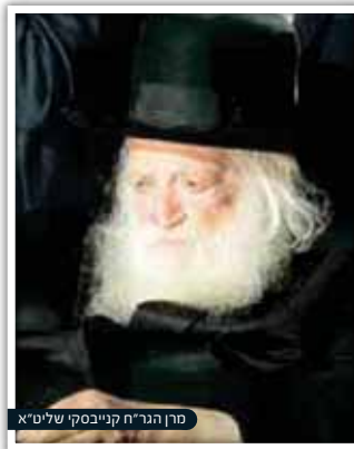
מרן הגר"ח קנייבסקי שליט"א

יהודי דתי, המשמש כמנכ"ל אחת החברות הגדולות ביותר במשק, ובעל עסקים רבים ומסועפים, נכנס לרבינו כשבפיו הצעה בלתי שגרתית: "אני עומד עתה בפני עסקת ענק, אולי אף עסקת חיי", הציג את דבריו בפני רבינו, "אך היא כמובן טומנת בחובה סיכון לא מבוטל, כדי להיות מובטח בהצלחתה, ברצוני להציע לרב שותפות בעסקה: כבוד הרב