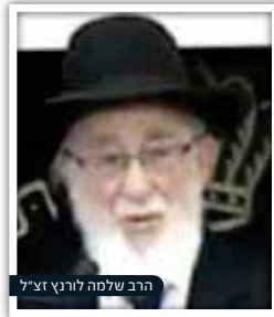
הרב שלמה לורניץ זצ"ל

חכמתו של מרן עמדה לו. בשיחה קצרה שניהל עמה הבין שאשה זו אינה מסוגלת להגשים את רצונה, כפי שאמנם היה. עצתו להקטין את התרומה לשליש, לא רק שלא הזיקה לנו, אלא היתה עזרה של ממש בנסיון להוציא את רצונה מן הכוח אל הפועל.