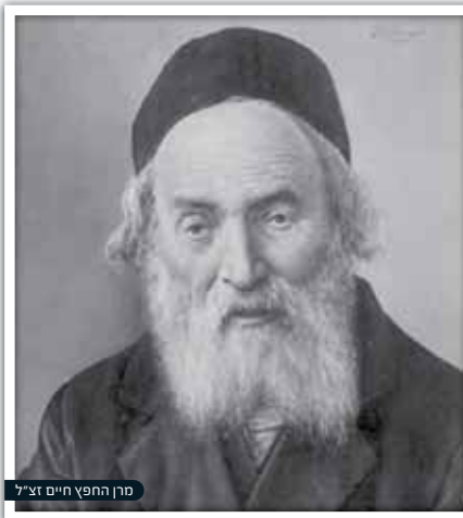
מן החפץ חיים זצ"ל