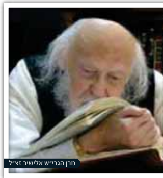
מרן הגרי"ש אלישיב זצ"ל

הדבר – לא ירשה שיזלזלו בכבודו של הקיסר הרוסי אותו עבד בנאמנות במשך עשרים וחמש שנים... לשמע טענות שכאלה נדהם קצין המשטרה לגמרי. הוא הודיע על כך לקצין המחוז. זה האחרון העביר מיד דין וחשבון למושל המחוז על אודות התקרית. מושל המחוז קרא אליו לחקירה את "הרב" ואת "החייל הניקולאיבי". בשמעו את טענותיו של החייל, שאל את "הרב" כיצד הרשה לפשע שכזה להתרחש, התנצל "הרב" שפשוט לא שמע, יען כי