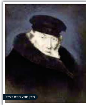
מחפץ חיים זצ"ל

עצה נפלאה לכך, הובאה בקובץ קב ונקי (תשע"ד) בשם הגר"ח קנייבסקי, שיתקן אדם צרכי רבים כדי שרבים יהנו ממנו, ואולי