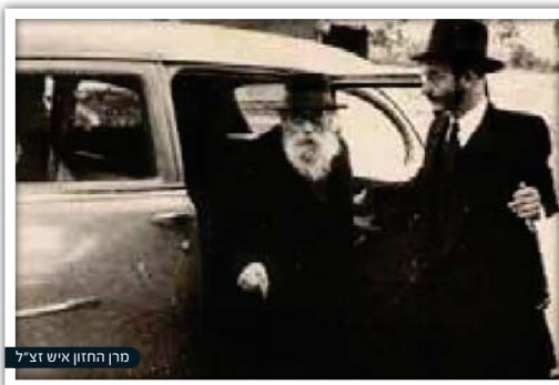
מרתון החזון איש זצ"ל

לפלא היה הדבר בעיניהם, מה לו לרבי לוי יצחק וליריד, הרי זהו מקום מסחר בלבד, וענייני מסחר רחוקים ממנו כמטחוי קשת! כאשר קרב אליהם רבי לוי יצחק, שמעו אותו ממלמל לעצמו שוב ושוב: "אוי ואבוי, הסוחרים שכחו!" "מה שכחנו?" שאלו אותו הסוחרים בדאגה. ענה להם רבי לוי יצחק: "אתם דנים בכובד ראש בענייני המסחר, כיצד לנהוג באופן המועיל ביותר לריבוי הרווחים, אך שכחתם לדון בדבר הזהירות שיש לנהוג בשעת המסחר, כדי שחלילה וחס לא תכשלו בעוון החמור של גזל ואונאה!"