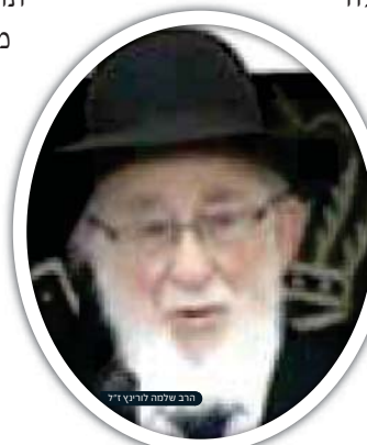
הרב שלמה לוריניץ ז"ל

לאחר זמן מה ערכתי חישוב, והגעתי למסקנה, כי בצורה כזאת לעולם לא יעלה העסק על דרך המלך, המאפיה תמשיך לצבור הפסדים, ובעליה יסתבכו יותר ויותר בסבך החובות. מתוך הנחה זו, הודעתי לבעלי המאפיה שעם כל הרצון הטוב, איני רואה כל אפשרות להמשיך ולגלגל את ההלוואות.