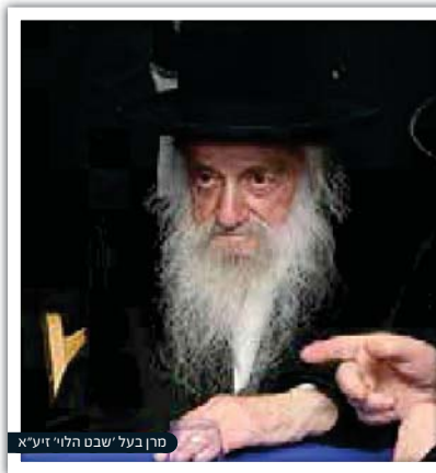
מרחן בעל 'שבט הלוי' זעירא