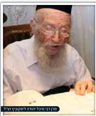
מרן רבי מיכל יהודה ליפקוביץ זצ"ל

כשראה מרן הגר"ח את הדברים, הגיב ואמר שאינו מסכים לסוף דבריו שעתה הוא בעל כשרון, כי גם היום איננו בעל כשרון, ואין לו על מה למחול, והוסיף מרן הגר"ח שאביו מרן הסטייפלר זצ"ל ראה פעם באיזה ספר, שהיה כתוב שם שהחזו"א בצעירותו לא היה בעל כשרון, והסטייפלר כתב והגיה בשולי הגיליון, "זהו שקר והוצאת שם רע!" הוסיף מרן הגר"ח ואמר ששם היה שקר, מצד מה שנכתב שלא היה בעל כשרון בצעירותו, וכאן הוא שקר, שהלא גם עכשיו איננו בעל כשרון.