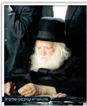
מרן הגר"ח קנייבסקי שליט"א

"דווקא את החמור הזה?!" התפלא העשיר. "לא אוכל לתת אותו. הוא עובד כמו כמה חמורים יחד, ואני מפיק ממנו רווחים עצומים!" האריז"ל שתק וחזר לטרקלינו של העשיר. עתה הביע את רצונו לראות את כל שטרי החוב של מארחו. העשיר הביא ערימה מכובדת של שטרות. "זה שטר הלוואה של היהודי השכן", החל להסביר, "זה שטר של פלוני הגביר מהעיר הסמוכה, שנקלע לאחרונה לקשיים כלכליים".