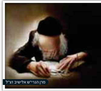
מרן הגרי"ש אלישיב זצ"ל

על ידיעותיו העמוקות של מרן החזון איש והתמצאותו המופלאה בכל תחום ועניין במכמני החיים, כתב בשו"ת שבט הלוי (ח"י סימן