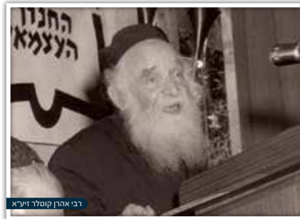
רבי אהרן קוטלר זיע"א

השפעה עליו. מיד נסע בדחיפות לשיקאגו, ותיקף כשנכנס לביתו של הרב דיבר אליו נמרצות כמפקד בצבא: "יש פה ענין של פיקוח נפש... עזרתכם נחוצה... אין פנאי אף לשהות קלה... יזדרז איפוא מר, לצאת עכשיו לדרכו למשך שלושה ימים... כבר סודר