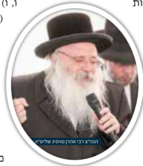
הגה"צ רבי אהרן טויסיג שליט"א

"אם כן", שאל הרבי, מה לך להרחיק נדוד? האלוקים שיפרנסך שם אינו יכול לפרנסך כאן!?" נכנסו הדברים בליבו, וביטל את ההפלגה המיועדת באניה "טיטאניק", שטבעה בהפלגת הבכורה! ולסיום, הן ידוע שהקדוש ברוך הוא הסתכל באורייתא וברא עלמא (זהו ח"א ה, א, ח"ב קסא, א), ואלמלא נתנה תורה היינו מבינים ציווייה מהתבוננות בברואים (עירובין ק ע"ב). בספר הברית (חלק א מאמר יד פרק ח) כתב, שכשם שיש ללמוד מהנמלה חריצות, "לך אל נמלה עצל, ראה דרכיה וחכם" (משלי ג, ו) כך יש לנוד לה על עודף חריצותה, שאמרו במדרש (דברים רבה ה, ב) שאינה חיה אלא אישה חודשים, וכל מאכלה חיטה ומחצה, ומעשה היה, ומצאו בבור שלה שלוש מאות כור - איזה שגעון כפיית! כמה "חיטה ומחצה" אפשר לזרוע באמה מרובעת? ודאי לאלף שנות חיי נמלה!