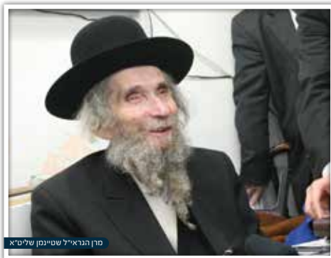
מרן הגראי"ל שטיינמן שליט"א

כך המציאות, שבכל הדורות היו אנשים לקויים בדברים שבין אדם לחברו יותר מאשר בדברים שבין אדם למקום, מכיוון שעניינים אלה אינם נראים איסורים חמורים כמו חילול שבת, אלא בסך הכל מריבות בהם בין איש לרעהו, לכן נכשלים בהם יותר. אך כתוב שעל עבירות שבין אדם לחברו נענשים יותר מאשר