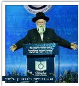
הגאון רבי יצחק זילברשטיין שליט"א

ברצוני לספר על יהודי כבן תשעים וחמש, שאימץ לו מנהג, והוא שכל פעם כשנודע לו שאני נמצא בביתי, הוא מגיע לדירה, פותח את הדלת, נכנס, מצביע עלי ואומר: "אתה יודע, בשואה היו עוד הרבה יהודים כמוך, עם זקן ופאות, שהיו לבושים גם הם בבגדים של יהודים חרדיים, והנאצים הכריחו אותם לשאת על בגדיהם את הטלאי הצהוב, ואחר כך שחטו אותם..."