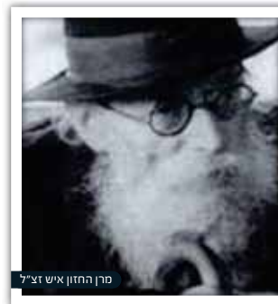
מרן החזון איש זצ"ל