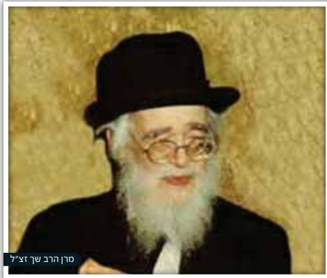
מחן הרב שך זצ"ל

אך לא. המלאך הרג את האתון, כפי שכותב רש"י בפרשת בלק בשם חז"ל: מפני כבודו של בלעם, שלא יאמרו הבריות שזוהי אתונו של בלעם שהוכיחה אותו