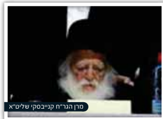
מרן הגר"ח קנייבסקי שליט"א

עוד נשאל מרן שר התורה, הגר"ח קנייבסקי שליט"א, במי שמרגיש כי יצליח להשקיע יותר בסדרי לימודיו הקבועים בגמרא רק אם לא יפריש מזמנו ללימוד ההלכה, האם חייב בקביעות עתים להלכה, והשיב: "בודאי".