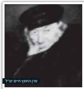
מרן החפץ חיים זצ"ל

סיים רבי אלהנן את הספדו: "עבד ה', עבד אמיתי, כולל בתוכו הכל! הוא קנוי לאדוני ועושה רצונו והוא שייך לו. זו היתה מציאותו של רבינו החפץ חיים זצ"ל, בכל לבבו, נפשו ומאודו עבד את בוראו וכל מעשהו עלי אדמות - לקדש שם שמים".