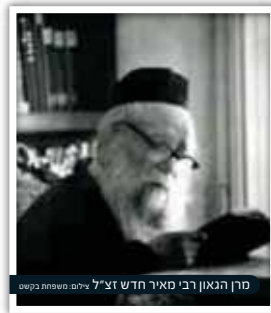
פרו הגאון רבי מאיר חדש זצ"ל ילדים שמתחבקים

אסביר לכם העניין עפ"י דוגמה מהחיים - המשגיח המשגיח את דבריו - ראובן בא אל שמעון ומספר לו: 'בנך יענקלה' היכה ילד אחר מהשכונה ללא כל סיבה', יענקלה שלי? - הגיב שמעון - לא יתכן, הוא ילד עדין, זה ממש לא מתאים, כדאי לך לבדוק את הדברים לפני שאתה בא אלי בטענות שוא.