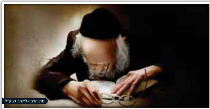
מחן הרב אלישיב זצוק"ל

ויש להכריע בעניינה. כאן נתגלה רבינו במנוחת נפשו: "הלא כבר קראו שלושה פסוקים. אם כך יכול הוא להשלים את כל הקריאה ולומר קדיש", אמר רבינו. וכך היה. המשיך בעל הקורא בקריאתו, אמר קדיש, ורק לאחר מכן ניגש רבינו להסתכל בספר התורה כדי להורות ולפסוק כדת תורה. צא ולמד מנוחת הנפש מה! העולם כולו שייך לתורה, ושום בעיה אין בכוחה להפוך את העולם! בכל פעם שהגעתי להסתופף במחיצתו, חשתי מין ענן של שלוה