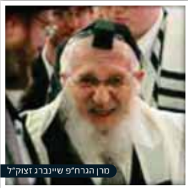
מנחם הרנ"פ שיינברג זצוק"ל