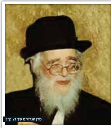
מרחן הגרא"מ שך זצוק"ל