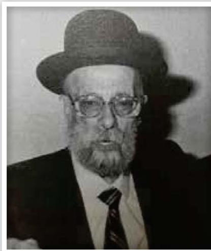
כבוד בית הכנסת

והיה מזכיר בענין זה את הפסוק: "ואני ברוב חסדך אבוא ביתך, אשתחוה אל היכל קדשך ביראתך", כשהוא מטעים וכופל בהדגשה מיוחדת את המילה האחרונה "ביראתך...", ורומז בהדגשתו זו לדברי חכמים: "לא מן בית-הכנסת ובית-המדרש אתה ירא, אלא ממי ששוכן בו ומזהיר על יראתו". וכאשר התארגן בעיה"ק ירושלים ועד של רבנים ועסקנים שנקרא בשם "מורא מקדש", במטרה לעורר את העם בארצנו הקדושה ובתפוצות הגולה, על החובה להיזהר משיחה בטלה בבתי כנסיות ומדרשות, עמד והצטרף לועד זה בכל חום לבו ונפשו, והיטה שכמו לכל פעולה שנדרשה ממנו. רגיל היה לספר מה שראו עיניו אצל הרב יעקב חיים סופר זלה"ה, בעל "כף החיים", שהיה מזדרז לצאת מביהכ"נ בגמר התפילה כשעמדו הציבור ב"עלינו לשבח", מתוך כוונה מיוחדת שלא יספיק מישהו לשוחח עמו אחרי התפילה בתוך ההיכל.