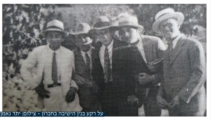
על רקע בנין הישיבה בחברון

במכתביו מצליח אהרון דוד הי"ד לסחוף את הקורא לא רק לעולמו הפנימי, אלא גם לאווירה הישיבתית אליה נסחף. בנימה מחוייכת הוא מספר להוריו כי "דרך אגב, אתם יודעים ששמי השתנה עם הכניסה לישיבה? מנהג הישיבה קובע, שלכולם קוראים בשם פרטי יחד עם שם עיר המוצא, כאמצעי הזיהוי