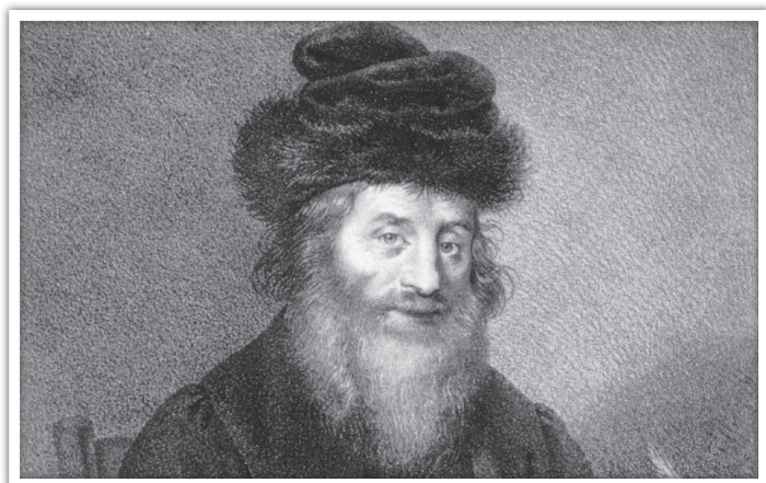
מהתעמקות בסוגיא תגיע לרום המעלות