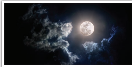
וכ"כ ברבינו בחיי (שמות י"ב, ב') בשם רבינו

חננאל ז"ל, שכל ארבעים שנה שהיו ישראל במדבר, היה הענן מכסה אותם ביום ועמוד האש לילה, ולא ראו שמש ביום ולא ירח בלילה. והוא שאמר הכתוב (נחמיה ט', י"ט): "ואתה ברחמיך הרבים לא עזבתם במדבר את עמוד הענן לא סר מעליהם ביוםם להנחותם בדרך ואת עמוד האש בלילה להאיר להם", ומהיכן היו קובעים חדשים על פי ראיית הלבנה, אלא בודאי עיקר המצוה בכתוב על פי החשבון, ע"כ.