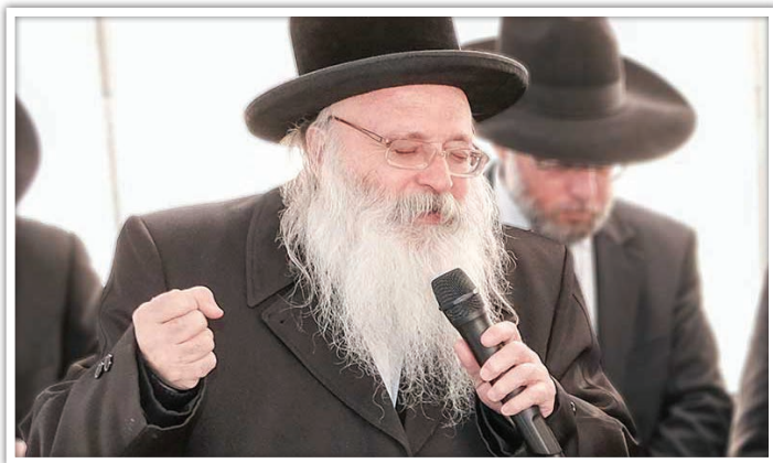
"שמור את יום השבת" (דברים ה', י"א)

הגה"צ רבי אהרן טויסיג שליט"א, על חיבוב המצוות של הצדיקים והחסידים