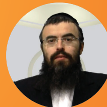
הרב אריה זילברשטיין שליט"א הדף היומי בהלכה • עברית שלוחה 1