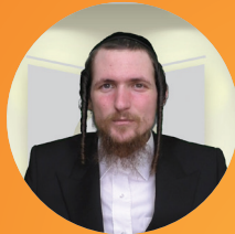
הרב מאיר שפרכר שליט"א הדף היומי בבלי • עברית שלוחה 2