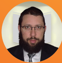
הרב יוסף מגנוז שליטי"א הדף היומי בהלכה • צרפתית שלוחה 2