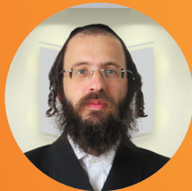
הרב אפרים סגל שליטי"א הדף היומי בהלכה • אידיש שלוחה 1/3/2