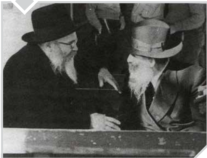
הגה"צ רבי יחזקאל לוינשטיין (מימין) בשיחה עם הגר"א לופיאן

מה כיוון המשגיח הגה"צ רבי יחזקאל לוינשטיין צוק"ל כשאיחל 'גוט שבת' לתלמידיו? ומדוע לא רצה רבי סלמן מוצפי ללמוד בכולל?