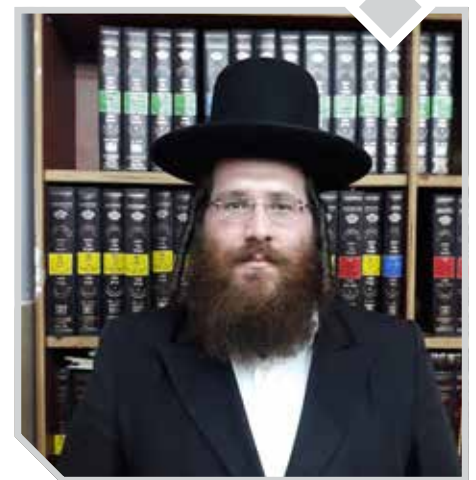
הרב אפרים פריימן