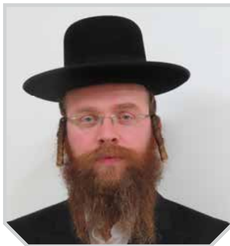
הרב שניאור אייזנבך