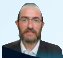
הרב מרדכי שלמה פריינד שליט"א הדף היומי בהלכה • אידיש שלוחה 1/3/1