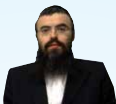
הרב אריה זילברשטיין שליט"א הדף היומי בהלכה • עברית שלוחה 1