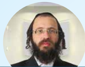
הרב אפרים סגל שליט"א הדף היומי בבלי • עברית-אידיש שלוחה 2 3 4