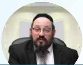
הרב יצחק לובינשטיין שליט"א הדף היומי בבלי • אנגלית שלוחה 2 6