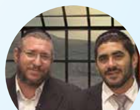
הר' שלום יכנס ואברהם פוקס הי"ו לקראת שבת מלכתא סיפורים ופנינים מפרשת השבוע שלוחה 7

קו השיעורים של 'דרשו' - לחייג, ללמוד, לדעת