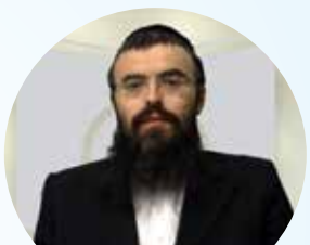
הרב אריה זילברשטיין שליט"א הדף היומי בהלכה • עברית שלוחה 1