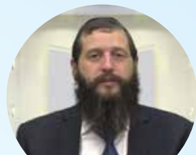
הרב אליהו אורנשטיין שליט"א הדף היומי בבלי • עברית שלוחה 2 1